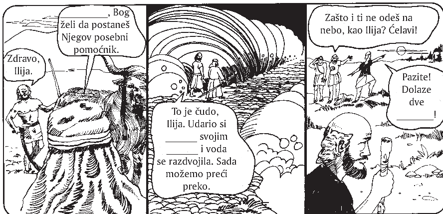
Jezekija, Jovane, Jelisije

Izaberi tačne reči i popuni praznine u stripu: